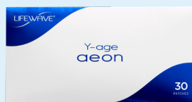
Aeon (30 แผ่น)