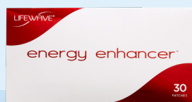
Energy Enhancer x 2 (30 แผ่น)